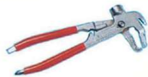
Pinza fissaggio contrappesi