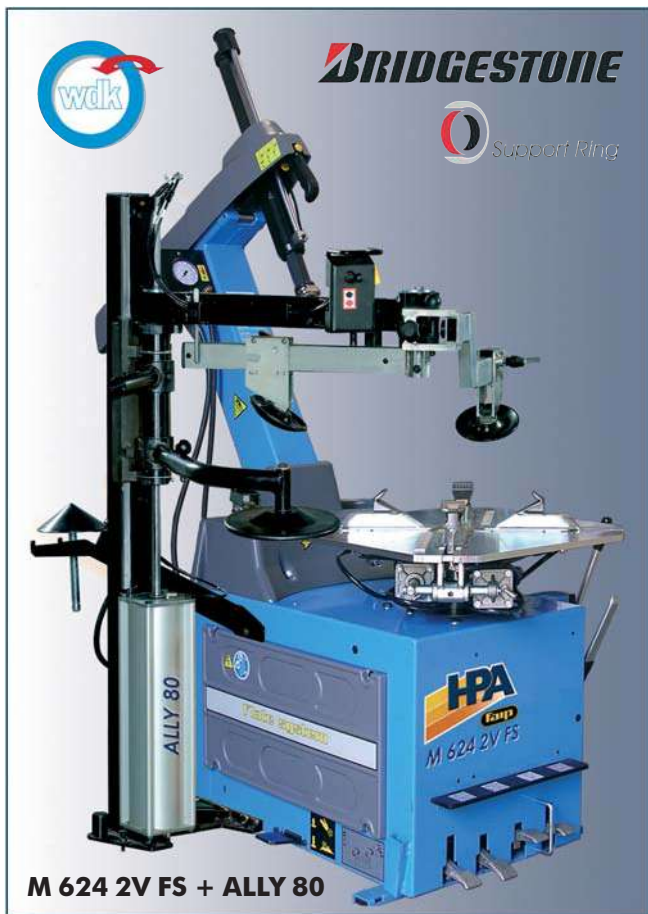
M 624 2V FS + ALLY 80

Grande capacità di bloccaggio e prestazioni superiori. Wide clamping range and top performances. Gran capacidad de bloqueo y altas prestaciones.