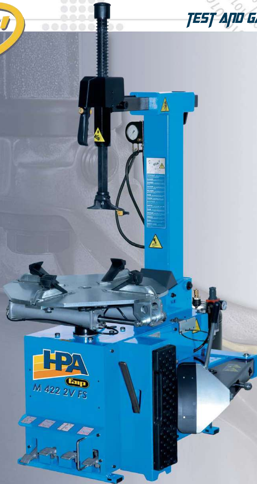
M 422 2V FS

Smontagomme automatico per cerchi fino a 22"