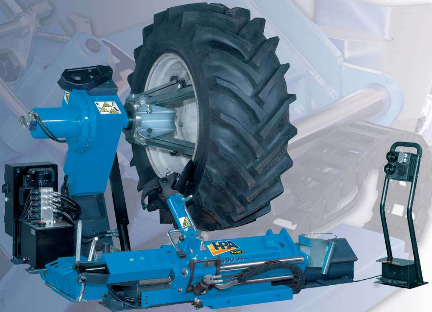
F 560 A