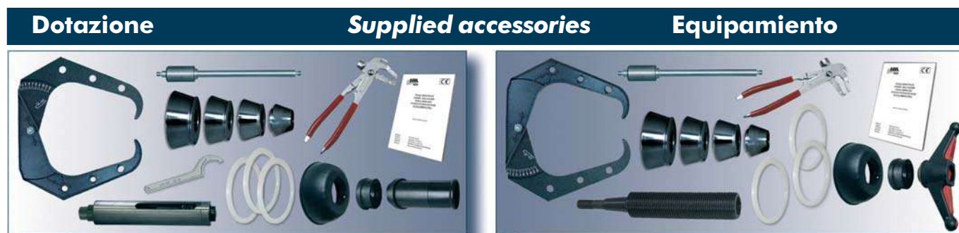
B 335 C Evo - B 235 C Evo